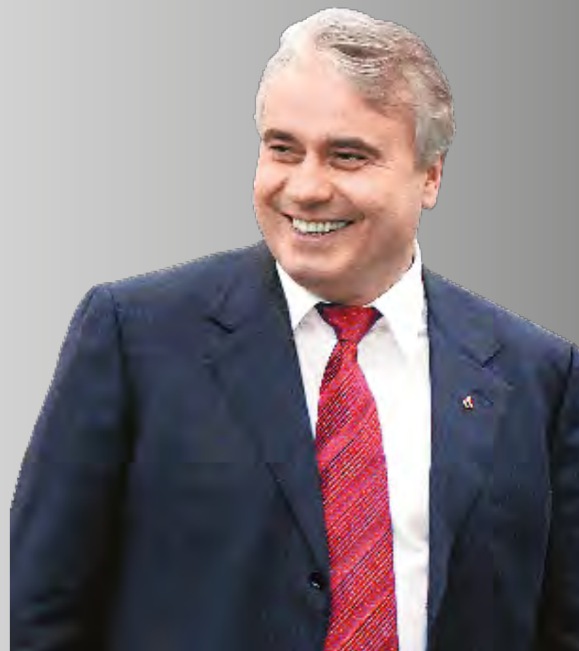
Павел Завальный, председатель Комитета Государственной Думы по энергетике, президент Российского газового общества

Уверен, реализация этой задачи даст людям другое качество жизни.