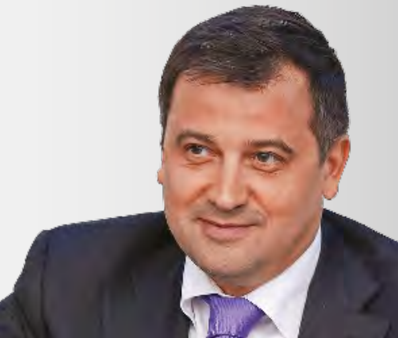
Кирилл Молодцов, помощник руководителя Администрации президента РФ

И зменения в 69-ФЗ «О газоснабжении в Российской Федерации» назрели достаточно давно. Это понятно уже с точки зрения определений, которые даются в этом законе по вопросам газоснабжения, а самое главное – по вопросам газификации. В этом смысле появление понятия «Единый оператор газификации» в стране, являющейся одним из крупнейших в мире экспортеров газа, является своевременным и, главное, нужным прежде всего для населения. Именно население является основным потребителем не только самого газа, но и тех услуг, которые государство должно ему предоставлять. В связи с этим решение на базе создания Единого газового оператора задачи, связанной с устойчивым энерго- и теплообеспечением граждан, – это приоритет государства, приоритет законодательных и исполнительных органов власти и, соответственно, компаний с государственным участием. Прежде всего я говорю о «Газпроме».